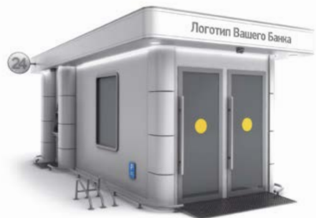
► Павильон, в котором возможно размещение 2-х рабочих мест для сотрудников банка. Площадь такой модели павильона – от 16 м 2

А. Бовырин: Сразу отмечу, что в этом плане у заказчика существует практически полная свобода действий: все, что он пожелает, – разумеется, технически возможное в рамках этого класса решений, –